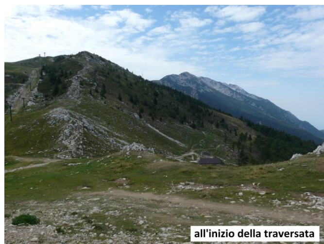
all'inizio della traversata