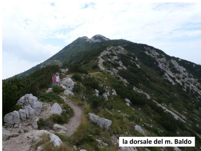
la dorsale del m. Baldo