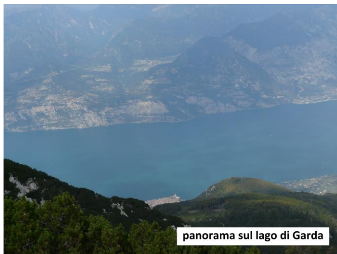
panorama sul lago di Garda