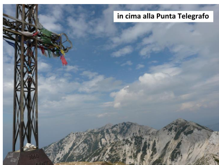
in cima alla Punta Telegrafo