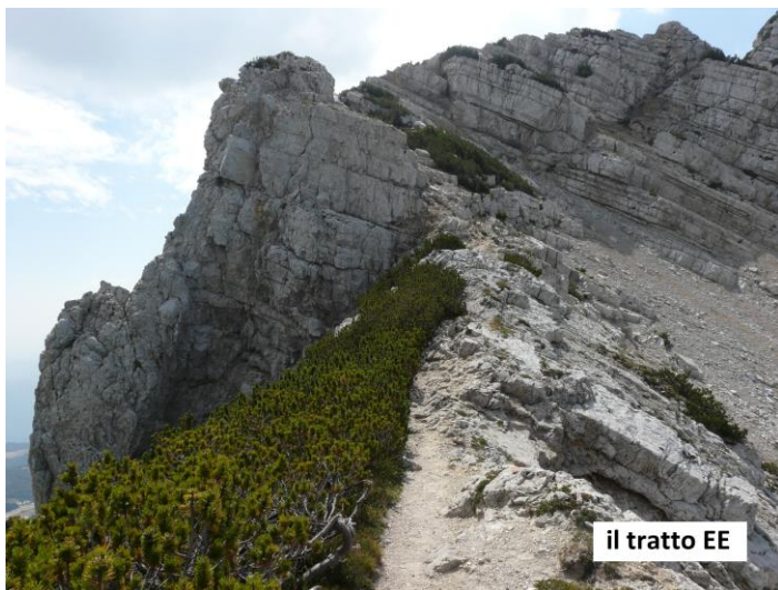
il tratto EE