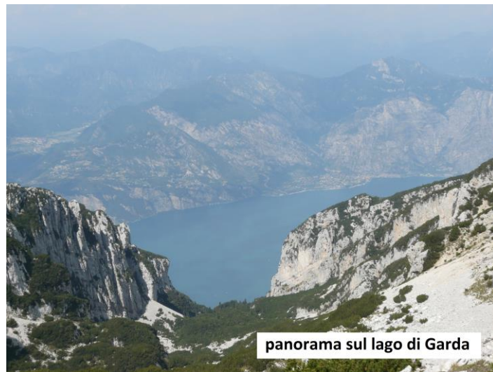
panorama sul lago di Garda