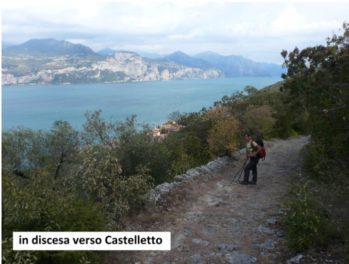
in discesa verso Castelletto