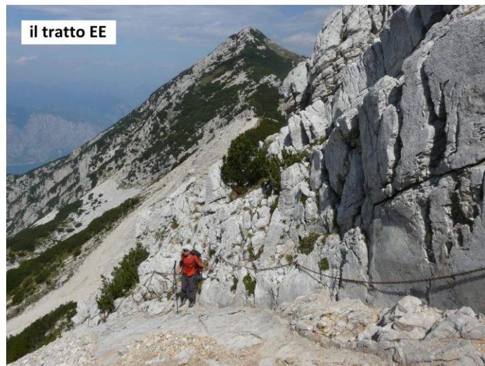
il tratto EE