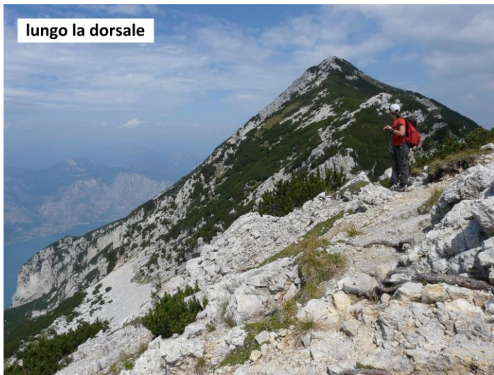
lungo la dorsale