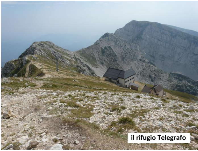
il rifugio Telegrafo