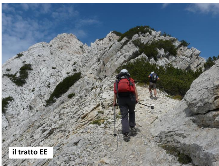
il tratto EE