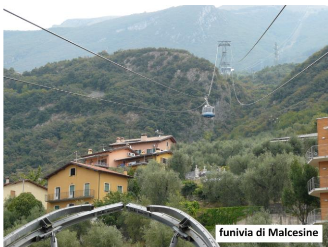
funivia di Malcesine

cartografia: Carta Tabacco 063 Monte Baldo, Malcesine, Garda in scala 1:25.000