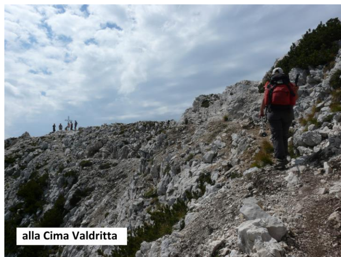
alla Cima Valdritta