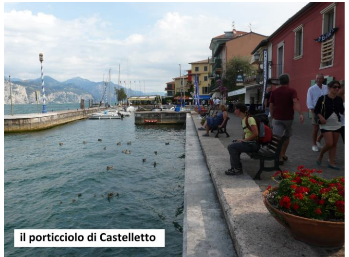
il porticciolo di Castelletto