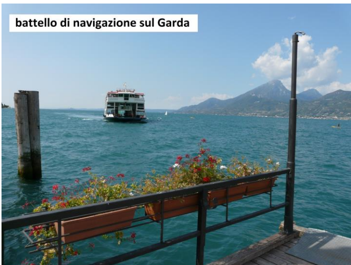
battello di navigazione sul Garda