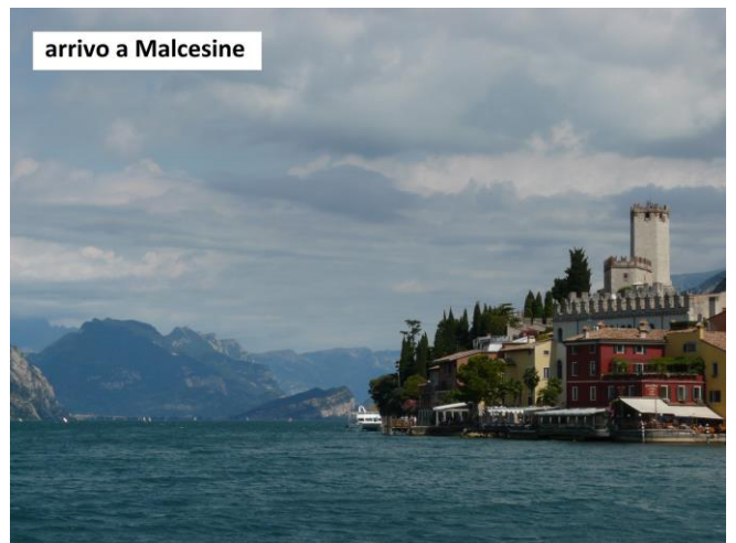
arrivo a Malcesine