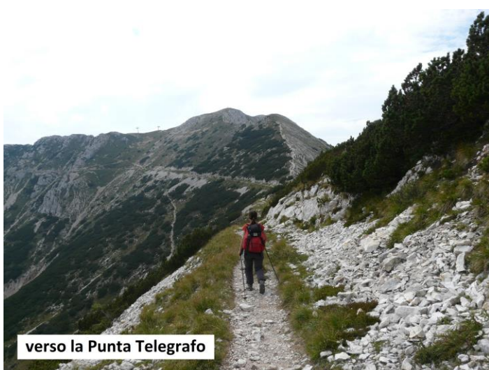
verso la Punta Telegrafo