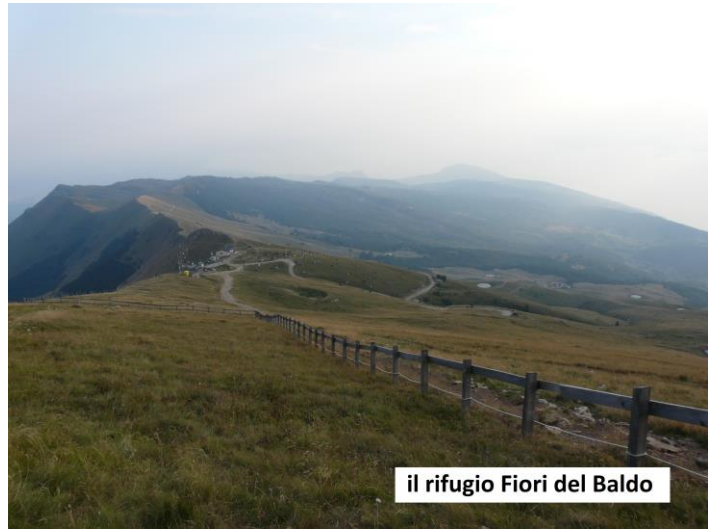
il rifugio Fiori del Baldo