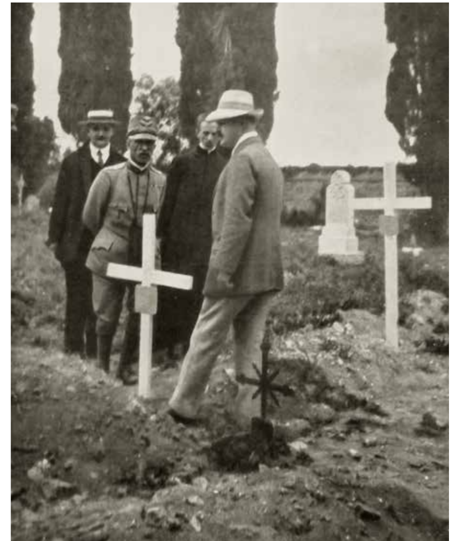
Fig. 1. Luglio 1915: Vittorio Emanuele III (assieme a Ugo Pascoli, podestà, Michele Abramich, Direttore del Museo Archeologico di Aquileia, e don Francesco Spessot, cappellano della parrocchia) osserva le tombe dei primi Caduti sepolti nel Cimitero della Basilica (foto del cappellano militare don Vittorio De Zanche, con didascalia Il Re, nel cimitero di un villaggio redento, visita le tombe dei nostri primi soldati caduti ). ( L'Illustrazione Italiana , anno XLII, 31, 1 agosto 1915, p. 96).

E se lo stesso fenomeno rilevato sul nome di Aquileia nel primo bollettino va notato nel detto e nel taciuto anche per le didascalie a quella che parrebbe essere la prima fotografia pubblica del Camposanto basilicale – visitato nel luglio 1915 da Re Vittorio Emanuele III 11 , la quale lo mostra