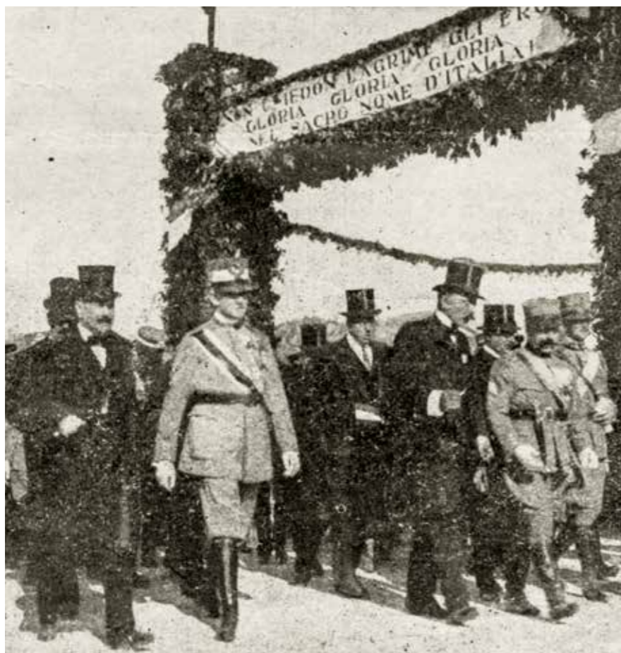
Fig. 13. Aquileia, 28 ottobre 1921: Emanuele Filiberto di Savoia-Aosta e l'on. Luigi Gasparotto, Ministro della Guerra, colti nel corteo funebre del Milite Ignoto. In alto, il succitato striscione ("Pro Familia", anno XXII, 45, 6 novembre 1921, copertina).

Naturalmente ciò apre una questione, ovvero se, come appare verosimile, i redattori del testo per l'Orazi si siano ispirati a tale striscione, fatto che, costituendo un terminus post quem , stabilisce una consequenzialità per la realizzazione del segnacolo.