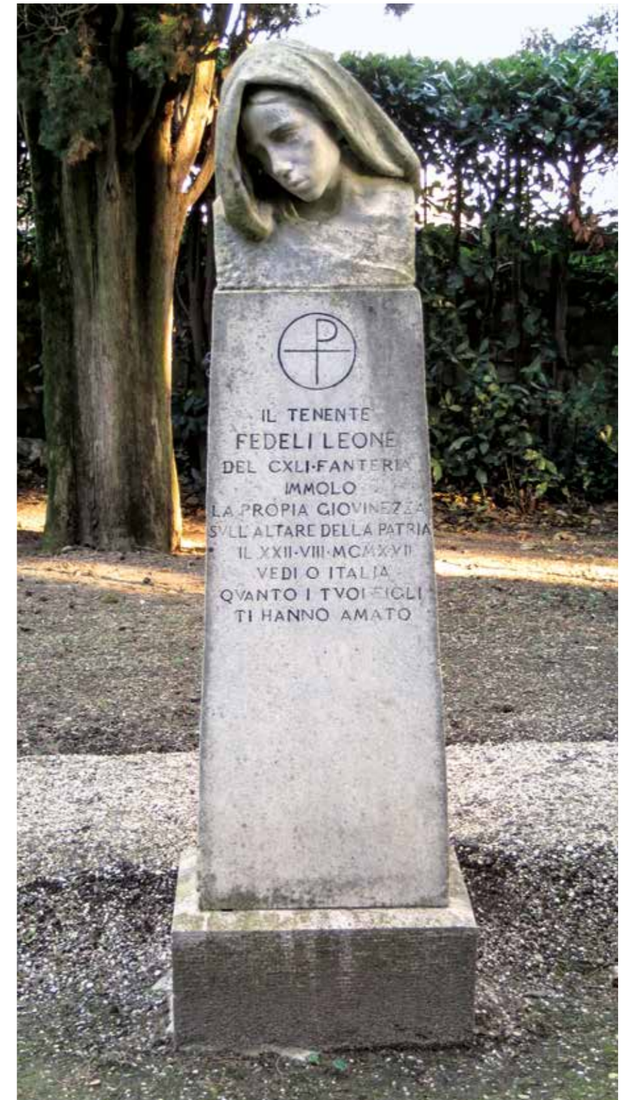
Fig. 6. Aquileia, Cimitero degli Eroi. Tomba di Leone Fedeli.