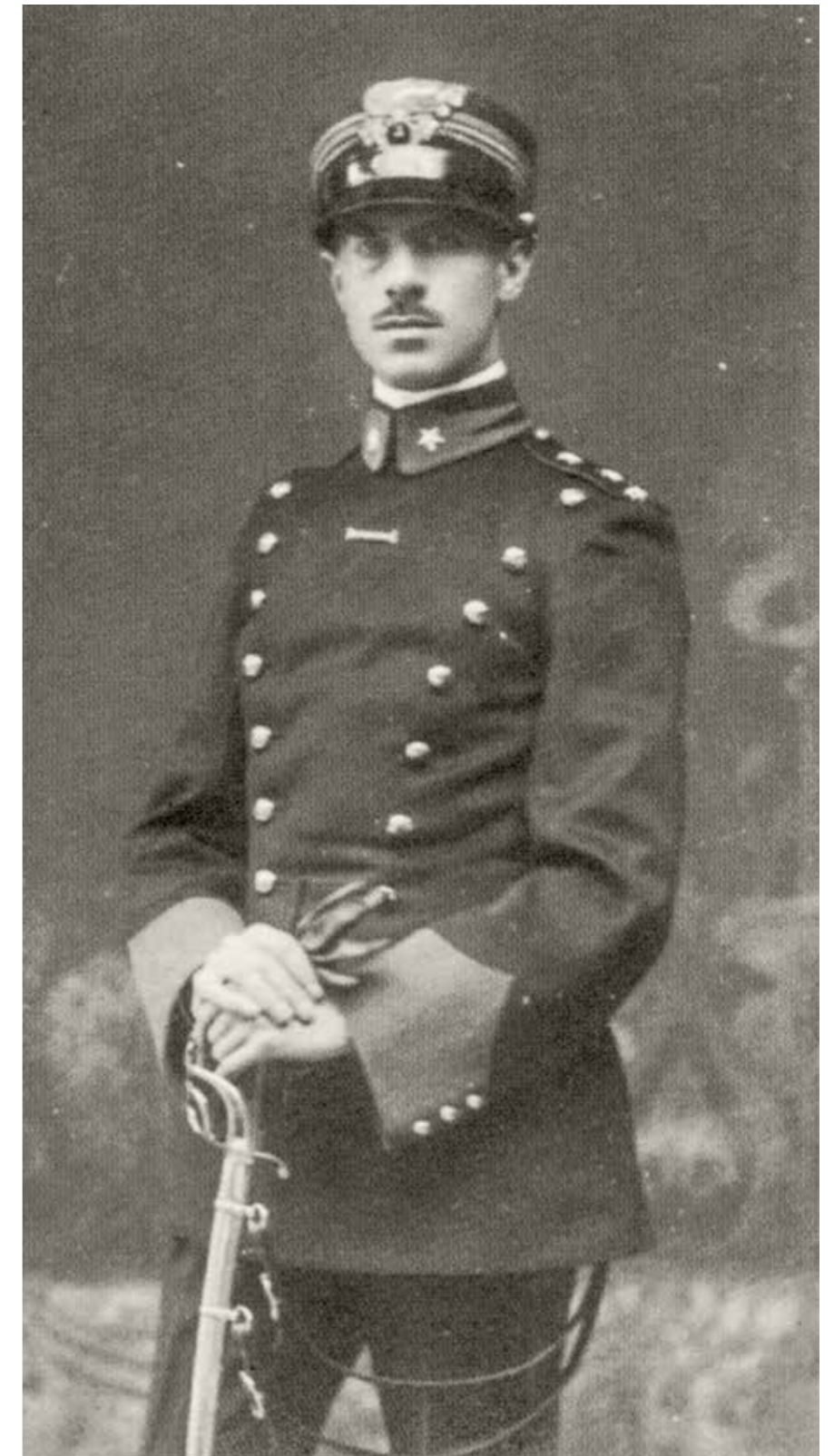
Fig. 21b. Ritratto di Severino Ubertis (CANOVA 2007, p. 83).