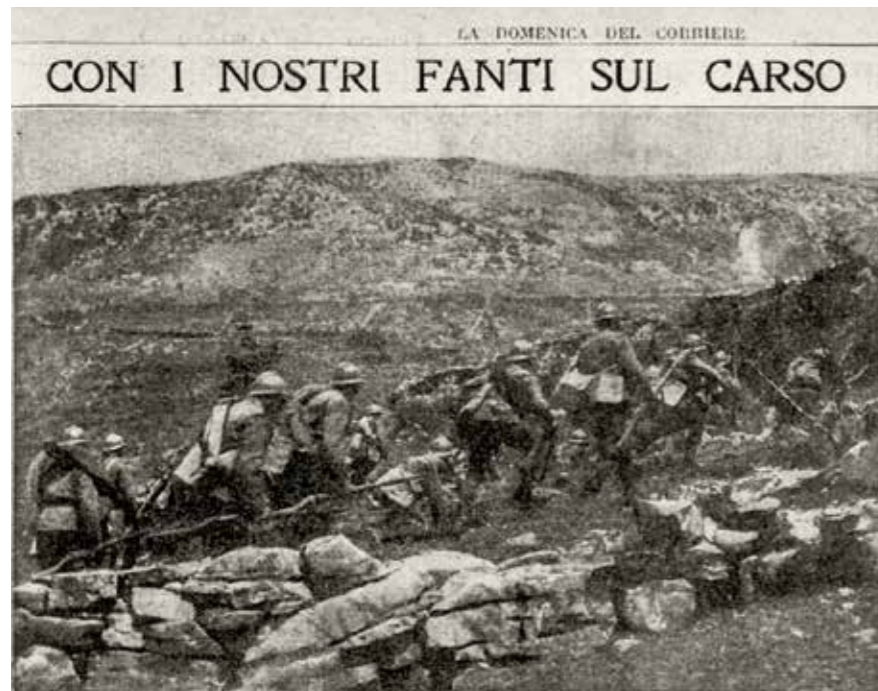
Fig. 22. Con i nostri fanti sul Carso. Avanzata delle fanterie presso Flondar ("La Domenica del Corriere", anno XIX, 25, 24 giugno-I luglio 1917).

Nato nella nobile casata Ubertis/degli Uberti, del Monferrato 170 , formato dall'ambiente familiare negli ideali sociali e umanitari, erede del culto per le tradizioni militari che già avevano visto il padre Eugenio capitano dei bersaglieri, Severino, iniziata la carriera all'Accademia Militare, fu di accesi sentimenti interventisti 171 . I ricordi tramandati dalla sua cerchia consentono, oltre che di ricostruirne spirito e sentimenti, anche di ridare giusta consistenza alla storia e al luogo della sua morte (fig. 22): se, infatti, si confrontano le date di ferimento e decesso, si nota uno iato di dieci giorni, che, nella realtà di quanto accaduto, ha il significato di un'agonia originata da squarcio al petto per esplosione di granata 172 . Morto nell'Ospedale da campo N. 006, in quel momento dislocato a Udine 173 , fu portato ad Aquileia per essere subito sepolto nel Cimitero della Basilica (la sua tomba è nel campo centrale, al terzo posto a destra de L'Angelo della Carità ), su interessamento personale del Duca d'Aosta, spinto a ciò sia dai legami ancestrali di amicizia con gli Ubertis, sia per la considerazione nutrita per il giovane ufficiale e le circostanze in cui egli incontrò il suo destino 174 . Da notare come – al pari, ad esempio, del Generale Ricordi e del Capitano della Torre – non vi sia alcun riscontro del suo seppellimento ad Aquileia