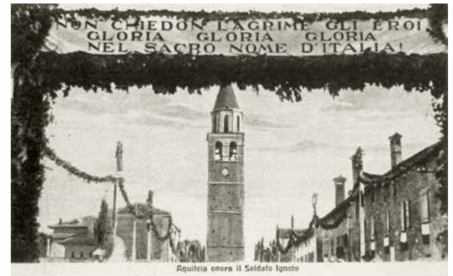
Fig. 12. Cartolina d'epoca, recante la didascalia «Aquileia onora il Soldato Ignoto», che mostra il cosiddetto arco trionfale posto all'imbocco di via Patriarca Popone, con striscione che recita «Non chiedono lagrime gli Eroi / Gloria Gloria Gloria / nel sacro nome d'Italia!» (Torre campanaria 2001, p. 47).

pennoni posti in sequenza e in doppia fila, tra loro uniti da tralci di alloro – destinato, il 28 ottobre 1921, a condurre verso l'edificio basilicale le Undici bare per la cerimonia del Milite Ignoto e ad avviare alla stazione ferroviaria la bara scelta e il suo corteo di accompagnamento 121 . Il particolare compare su cartoline destinate a incidere nel grande pubblico il ricordo di quanto accaduto 122 (fig. 12) e nei servizi fotografici eseguiti per l'occasione, poi pubblicati su libri e testate 123 , dando particolare risalto al passaggio del Duca d'Aosta e del Ministro della Guerra, Luigi Gasparotto, «ideatore della Cerimonia», organizzata in ogni suo particolare dai vertici romani 124 (fig. 13).