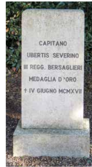
Fig. 21a. Aquileia, Cimitero degli Eroi. Tomba di Severino Ubertis.