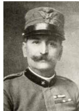
Fig. 16b. Ritratto di Alessandro Ricordi ( "L'Illustrazione Italiana" , anno XLIV, 23, 10 giugno 1917, p. 486).