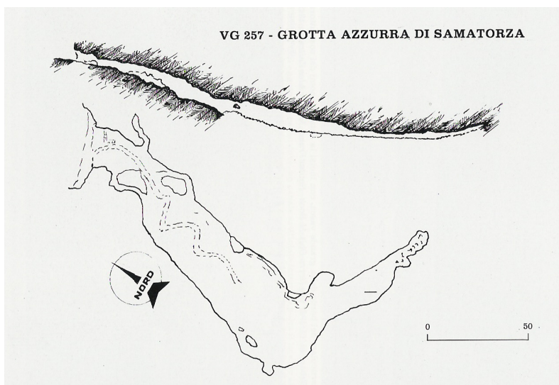
VG 257 - GROTTA AZZURRA DI SAMATORZA

L'escursione proposta per questa domenica è poco più di una sana passeggiata, il dislivello irrilevante ed il percorso non impegnativo.